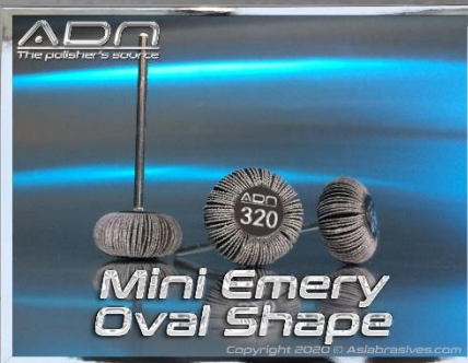
Ø 20 mm x 10 mm