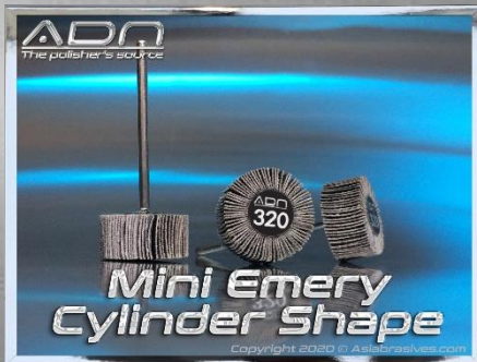
Ø 20 mm x 10 mm