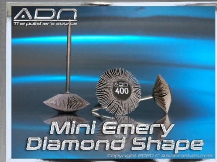
Ø 25 mm x 10 mm

ติดตั้งบนเพลลา Ø 2.35 มม. ล้อเหล่านี้ ผลิตขึ้นสำหรับการขัดโลหะทุกชนิด และเป็นเครื่องมือที่ สมบูรณ์แบบสำหรับการขัดโลหะแข็ง แผ่นขัดมีความหนาแน่นสูงทำจาก "ผ้าขัดที่ยืดหยุ่น คุณภาพสูง" ซึ่งคัดสรรและนำเข้ามาจากประเทศเยอรมัน และ ประเทศญี่ปุ่น ทำให้ล้อเหล่านี้มี ประสิทธิภาพในการขัดที่มีประสิทธิภาพสูงซึ่งจะขจัดรอยเปื้อนบนพื้นผิวใด ๆ ด้วยการขัดที่ เรียบเนียนอย่างเหลือเชื่อ